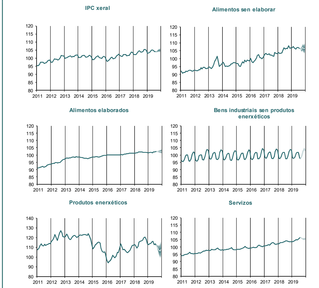
Gráfico 2.- EVOLUCIÓN DO IPC