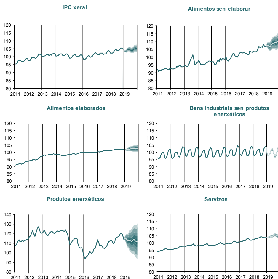
Gráfico 2.- EVOLUCIÓN DO IPC